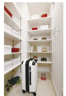
シューズインクロー & スリッパ掛け