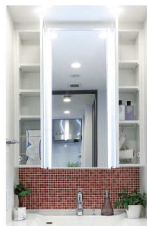
三面鏡裏収納 & LEDツインライト

女性のシングルライフをオシャレに演出し、半透明で明るい光を取り込めるスライディングウォールを採用しています。