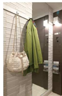
ブラインドフック & 姿見ミラー