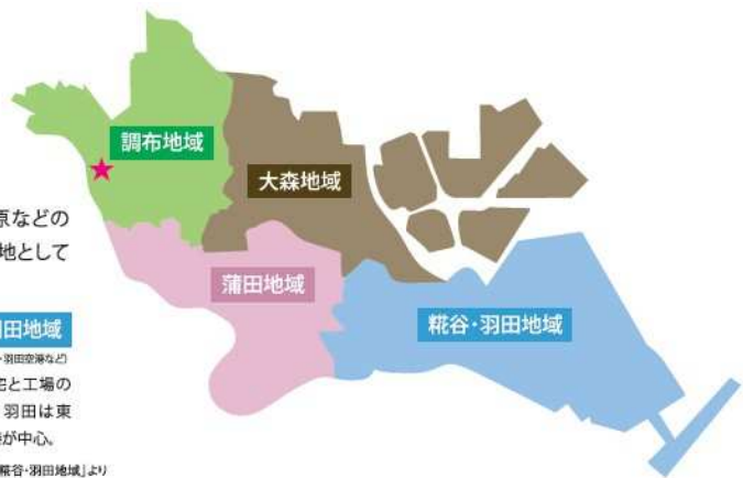
大田区ホームページ「調布地域」「大森地域」「蒲田地域」「糎谷・羽田地域」より